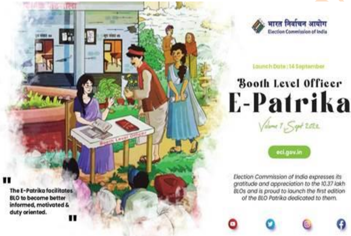
|| The E-Patrika facilitates BLO to become better informed, motivated & duty oriented. ||