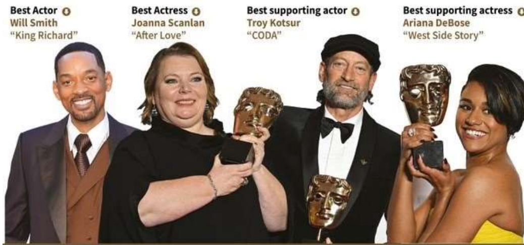
Best Actor Will Smith "King Richard" Best Actress Joanna Scanlan "After Love" Best supporting actor Troy Kotsur "CODA" Best supporting actress Ariana DeBose "West Side Story"