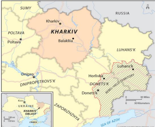
Figure 1. Map of Kharkiv