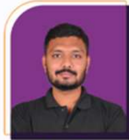
रितेश खिरड अर्थव्यवस्था आणि राज्यव्यवस्था तज्ञ